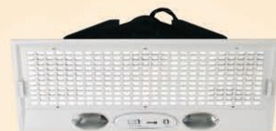
19019 Aspiratore "FABER" mod. INCA 3 vel. cm L 70