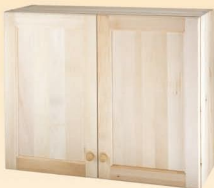
19004 Pensile doppia anta aperto in basso per scolapiatti cm L 80 x H 72 x P 34