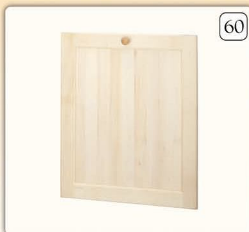
19008 Anta per lavastoviglie ad incasso cm L 60 x H 72