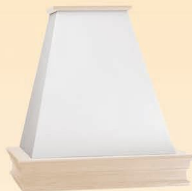
19017 Kappa con aspiratore in acciaio laccato bianco e cornice in legno cm L 60 x H 65 x P 50