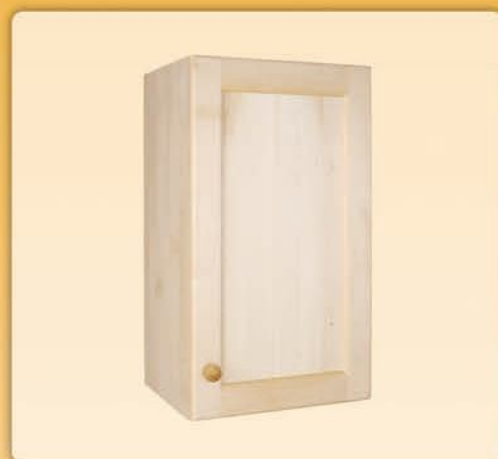
19012 Pensile mono anta con bugna in legno e ripiano interno cm L 40 x H 72 x P 34