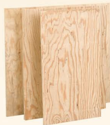
19042 Schiena in multistrato fenolico di pino cm 74,5 x 43 sp. 1