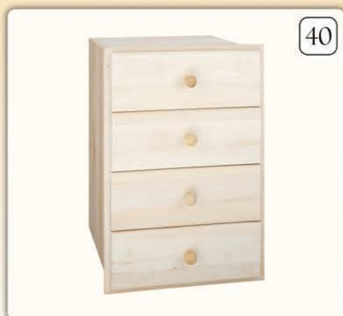
19005 Cassettiera ad incasso con telaio cm L 40 x H 72 x P 52