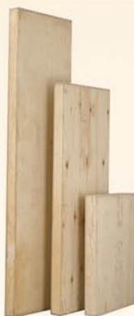
19039 Fianco in multistrato fenolico di pino cm L 10 x H 80 x P 56