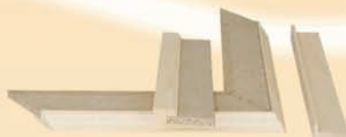
19035 Profilo per cappello pensile cm L 56 x 40 x H 200