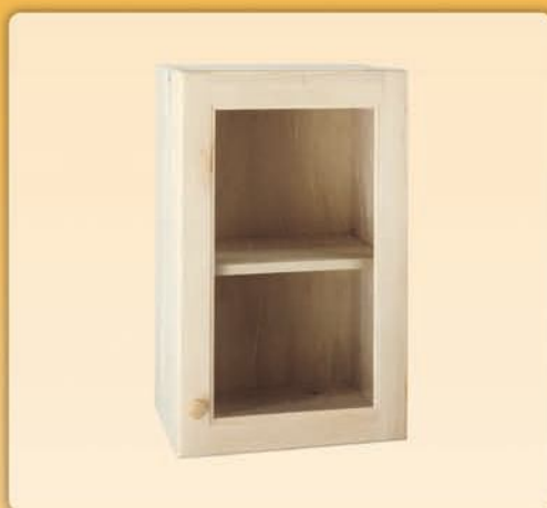
19003 Pensile mono anta per bugna in vetro con ripiano interno cm L 40 x H 72 x P 34