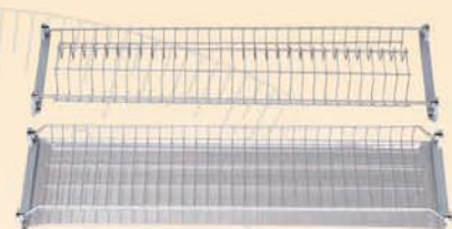
19018 Scolapiatti inox con due elementi e vassoio in PVC per pensile 19004