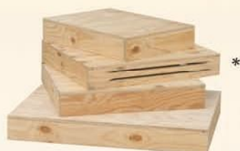
19033 Base in multistrato fenolico di pino cm L 40 x H 10 x P 56