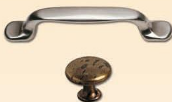
Maniglie e Pomoli nel nostro catalogo PRONTOLEGNO