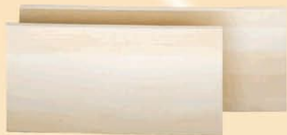
19030 Mensola stondata un lato cm 80 x 30 sp. 2,5