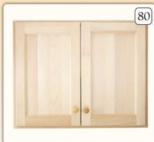
19007 Doppia anta con telaio cm L 80 x H 72