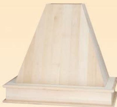
19009 Kappa con aspiratore FABER a tre velocità con filtro estraibile cm L 90 x H 72 x P 50